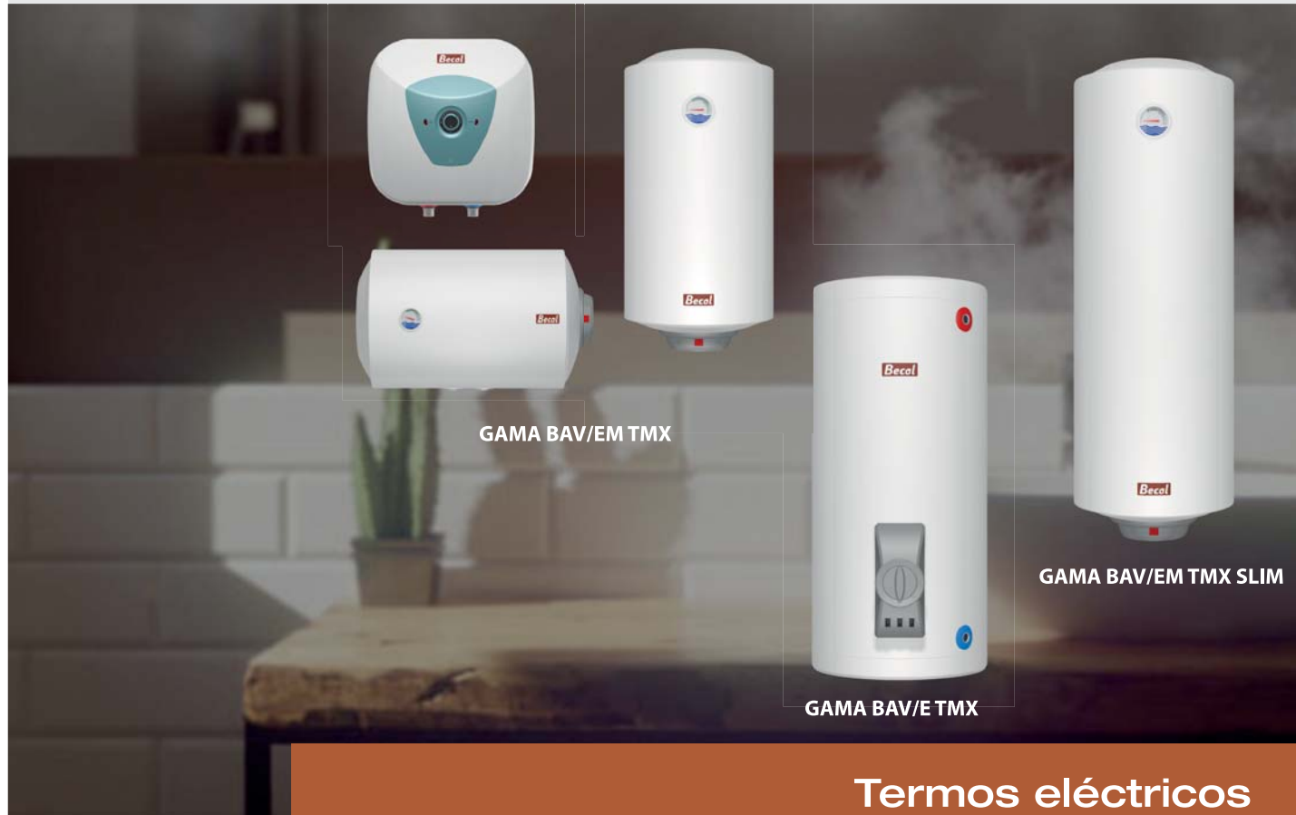
GAMA BAV/EM TMX